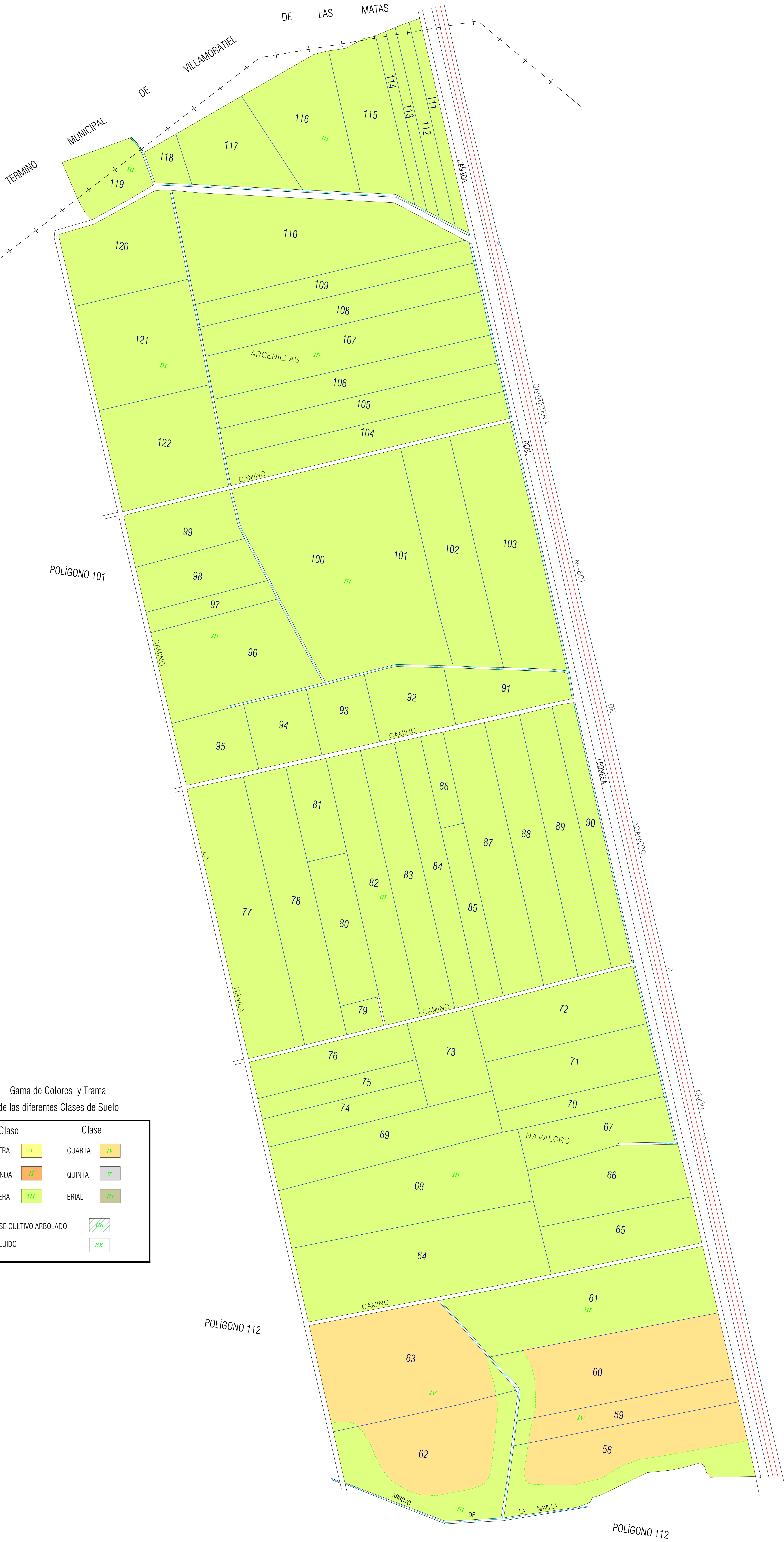
Gama de Colores y Trama de las diferentes Clases de Suelo